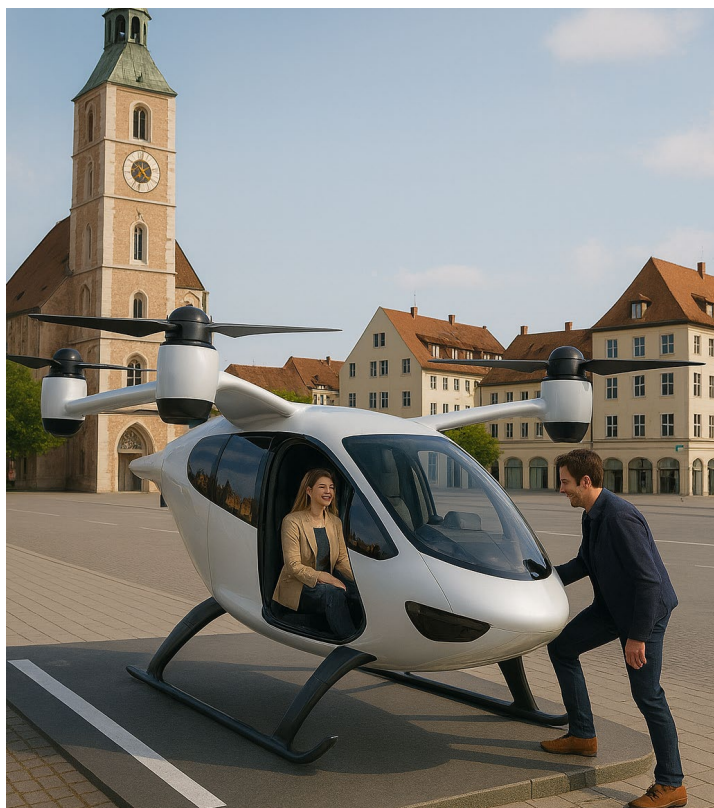
Vision 2030: Flugtaxi-Haltestelle in der Ingolstädter Innenstadt – der Einstieg in die urbane Mobilität der Zukunft

Was heute noch nach Zukunftsmusik klingt, könnte Anfang der 2030er-Jahre Realität werden: elektrische Flugtaxis zwischen Ingolstadt und dem Münchner Flughafen. Ein entsprechendes Projekt aus Ingolstadt wurde nun als Kandidat der Internationalen Bauausstellung (IBA) Metropolregion München ausgewählt – ein wichtiger Schritt für die Weiterentwicklung innovativer Mobilitätslösungen. Die IBA bringt über einen Zeitraum von zehn Jahren Kommunen, Wirtschaft, Wissenschaft und Gesellschaft zusammen, um neue Ansätze für die „Räume der Mobilität“ zu erproben. Im Fokus des Ingolstädter Projekts steht die Erschließung des unteren Luftraums als Testfeld für eVTOLs (electric vertical take-off and landing aircraft) – inklusive der notwendigen technischen, rechtlichen und organisatorischen Rahmenbedingungen sowie passender Start- und Landeinfrastruktur.